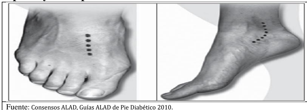
Figura 4. Las líneas punteadas muestran donde tomar el pulso de las arterias pedia y tibial posterior.