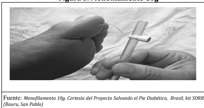
Figura 3. Monofilamento 10g

Fuente: Monofilamento 10g. Cortesía del Proyecto Salvando el Pie Diabético, Brasil; kit SORRI (Bauru, San Pablo)