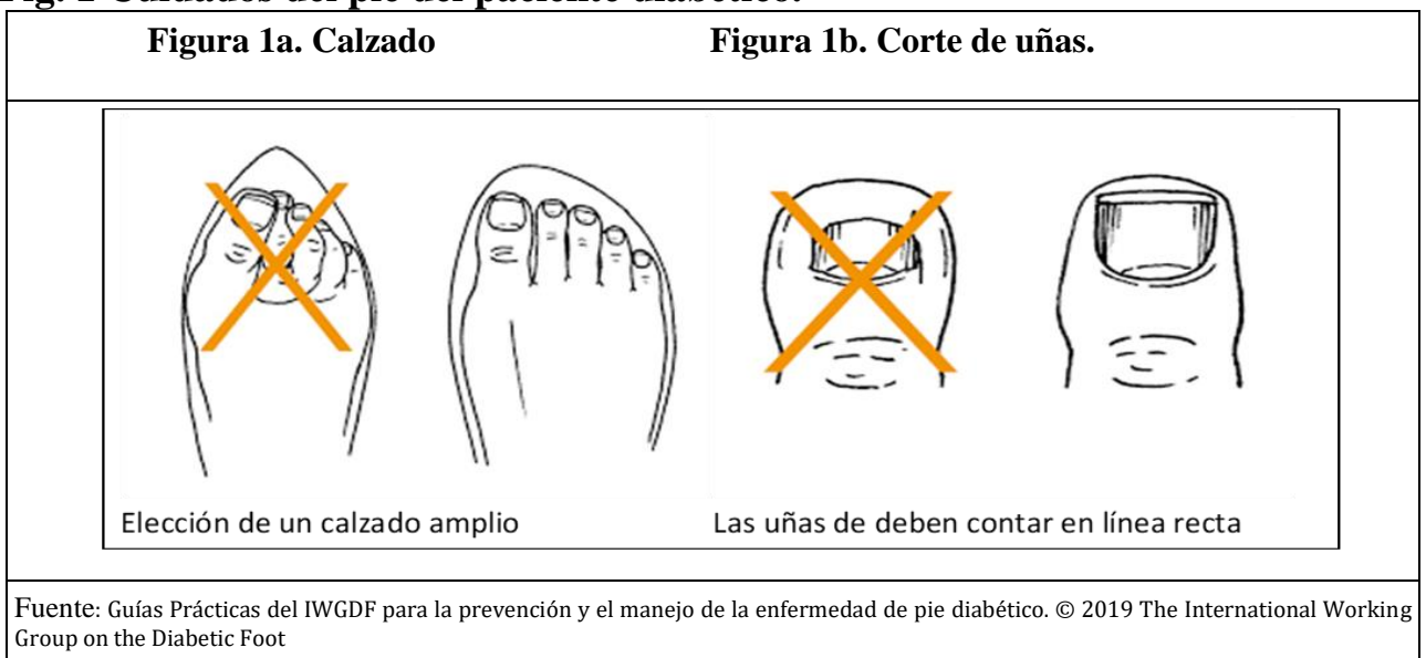
Fig. 1 Cuidados del pie del paciente diabético.

Ejercicios de pies La persona con pie diabético debe ser incluida en actividades de rehabilitación, desde el inicio de la patología, con un plan de tratamiento adecuado a su capacidad funcional, su nivel de actividad previa y el momento evolutivo de la enfermedad. Las contracturas musculares y alteraciones posturales, se previenen con actividad repetida y frecuente.