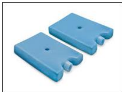
Ejemplo de hielera y gel congelante (pingüinos)