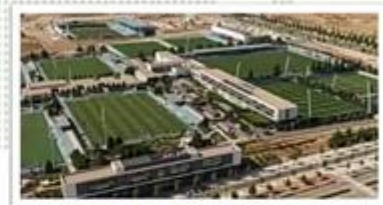
Controles Fuera de Competencia

S5 DIURÉTICOS Y AGENTES ENMASCARANTES Los diuréticos y agentes enmascarantes siguientes están prohibidos, al igual que otras sustancias con estructura química o efectos biológicos similares.